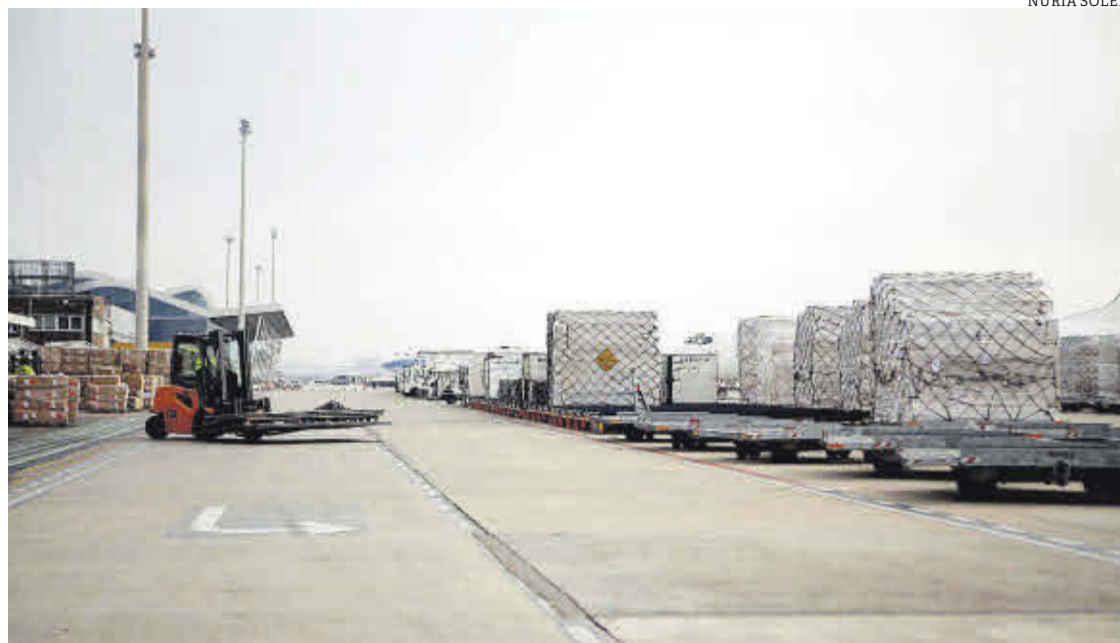
Mirada a Europa. Las empresas aragonesas se aprovecharán de la colaboración en el marco comunitario.

ALIA tendrá un rol facilitador a través del cual todos los miembros del clúster se beneficiarán de su pertenencia al mismo, contribuyendo a un aumento del retorno de la inversión en I+D para Aragón, así como aumentando la interacción con otras entidades europeas, estableciendo un marco de colaboración estable, aprovechando economías de escala, favoreciendo la participación de estas entidades y empresas aragonesas en un marco internacional y dando un salto cualitativo y cuantitativo en lo que a internacionalización se refiere.