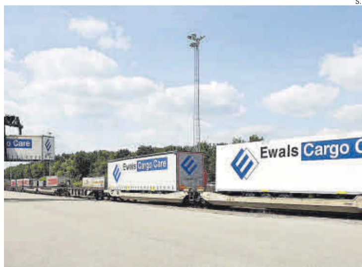
Multimodalidad. Camiones de Ewals Cargo Care subidos a un tren.