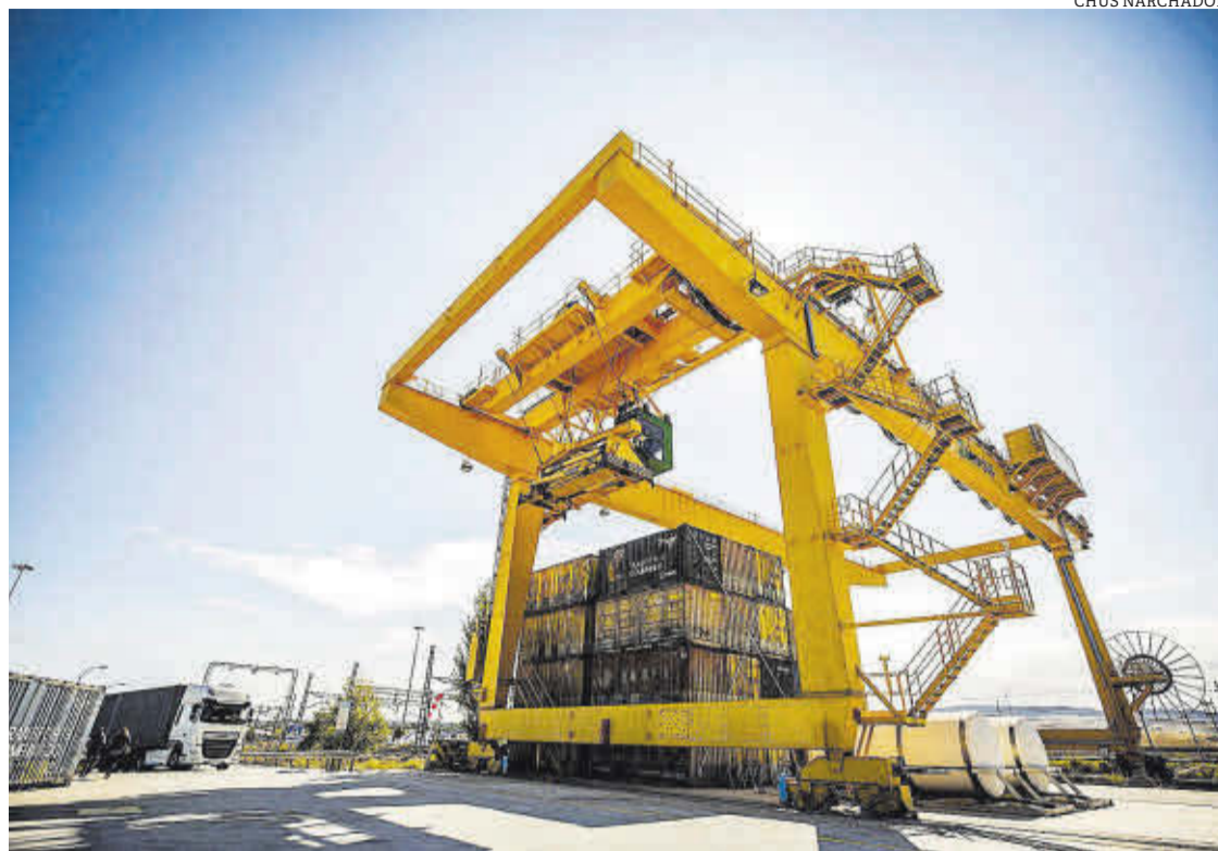
Transformación. Los proyectos de investigación buscan aumentar la eficacia y sostenibilidad de los procesos.

Estos trabajos tratan de aglutinar todos los campos que la logística abarca, desde el transporte de mercancías hasta la mejora de procesos