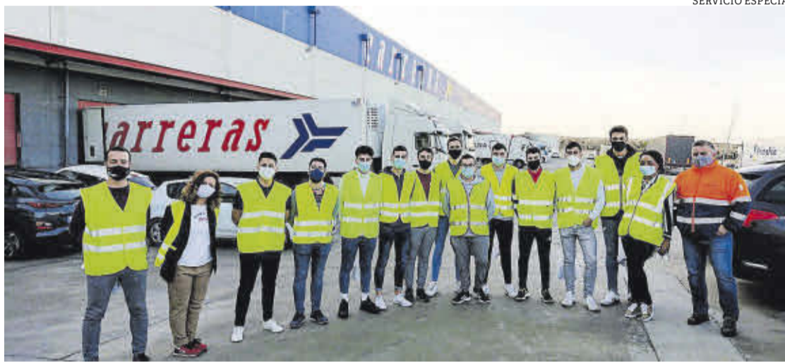
Metodología 360°. La formación se completa con salidas a empresas y 'masterclass' con profesionales.

Océano Atlántico ofrece una completa formación en el ámbito de la logística con una metodología de aprendizaje activa, de la mano de las empresas del sector logístico, que posibilitan una visión empresarial realista y de calidad. El centro fue pionero en la comunidad al lanzar el Grado Superior en Transporte y Logística, una formación de dos cursos de duración más un periodo de